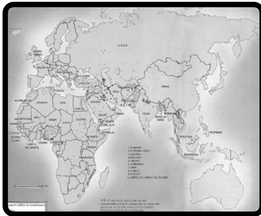
Atlas geopolítico Aguilar

Después de ocho siglos de presencia árabe en España y de una fecunda convivencia medieval, la identidad nacional española se construyó sobre la homogeneidad religiosa y cultural, y la erradicación de todo lo ajeno. Los moriscos se convirtieron entonces en objeto de desprecio, hasta llegar a ser expulsados en 1601. Más adelante, durante el siglo XIX, diversos conflictos bélicos con Marruecos favorecieron el desarrollo del estereotipo del árabe salvaje y fanático en la imaginería popular. Existe en la memoria colectiva de los españoles, expresada, entre otros, en los libros escolares y los medios de comunicación, un manifiesto rechazo a la figura del moro : según las encuestas, los árabes y los musulmanes son, después de los gitanos, los que mayor repudio suscitan entre la población española.