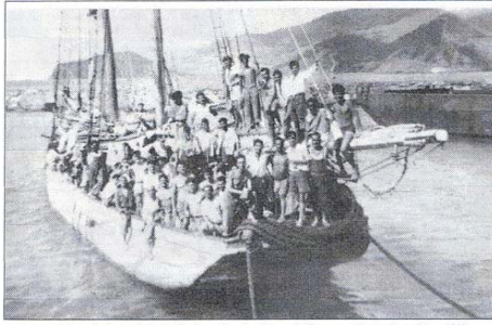
Imagen de los tripulantes de "La Elvira" a su llegada a Puerto de Guaymas, Venezuela, en Mayo 1949