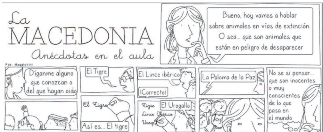
Ilustración de la viñeta: Mauricio Maggiorini Tecco