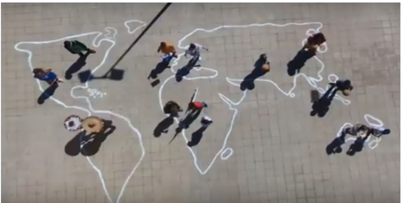
IES Ichasagua de Arona, Tenerife ganadores del premio aulas por la convivencia 2018

El derecho a la educación es mundialmente reconocido desde que en 1948 se proclama la Declaración Universal de Derechos Humanos. Además, la Convención sobre derechos del niño, reconoce este derecho a todos los niños y las niñas. Y es fundamental para garantizar este derecho, que el sistema educativo reconozca la diversidad de su alumnado y garantice los procedimientos, servicios y recursos necesarios para que dicha diversidad no sea un freno para hacer efectivo el principio de igualdad de oportunidades.