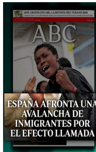
Diario ABC el 17 de Junio 2018

Los medios de comunicación tienen la responsabilidad de no incidir en la crispación social. Ni los medios ni ningún representante público deben hacer pensar que la inmigración es un problema.